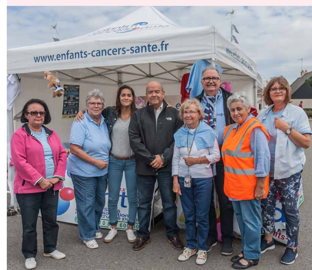
L'équipe de Enfants Cancers Santé

Enfants Cancers Santé est reconnue d'utilité publique depuis 2005. Grâce à cette reconnaissance, vos dons ou votre adhésion sont déductibles de vos impôts sur le revenu, dans les limites fiscales prévues par la loi des finances.