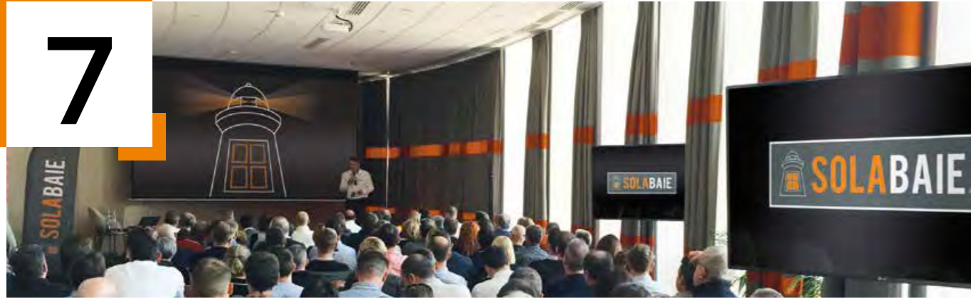
Convention nationale Solabaie®